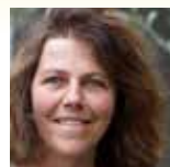
Ingrid SEYMAN La petite conformiste Editions Philippe Rey