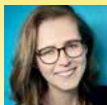
Aly DEMINNE Les bâtisseurs du vent Editions Flammarion