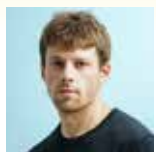
Mathieu PALAIN Sale gosse Editions L'Iconoclaste