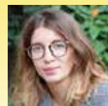
Isabelle MAYAULT Une longue nuit mexicaine Editions Gallimard