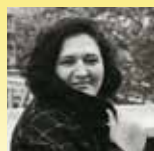
Sofia AOUINE Rhapsodie des oubliés Editions de la Martinière